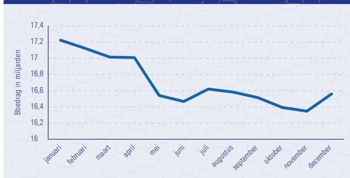
TOTALE BEDRAG DAT AAN CONSUMPTIEF KREDIET UITSTAAT BIJ HUISHOUDENS GEDURENDE 2017

Wat betreft de rentetarieven kan 2017 worden gekarakteriseerd als een relatief rustig jaar. Bij zowel PL als DK zijn de gemiddelde rentetarieven redelijk stabiel gebleven. Hiermee lijkt in 2017 een einde te zijn gekomen aan de dalende trend die al een aantal jaren zichtbaar was (zie figuur rechts). Vanaf begin 2018 is bij DK sprake van een daling van de gemiddelde tarieven. De reden hiervoor is gelegen in het feit dat een drietal producten van kredietverstrekker Interbank vanaf begin dit jaar niet meer worden aangeboden. De gemiddelde tarieven van PL laten juist een lichte stijging zien sinds het einde van 2017. Dit zorgt ervoor dat de gemiddelde tarieven van PL en DK steeds dichterbij elkaar toe bewegen.